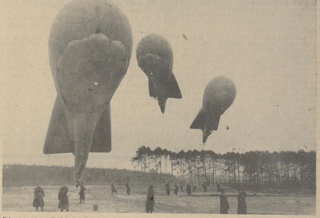
Die ersten Bilder von deutschen Sperrballons. Gegen die Angriffe feindlicher Flieger hat die deutsche Luftwaffe als wirksame Abwehr Sperrballons geschaffen, die Städte und Industrie. Die neuen Ballon-Sperrnetze wurden durch ihre fast unsichtbaren Drähte geschützt. Die ersten Ballons fertig zum Aufstieg. — (3er) Presse-Eingelast.