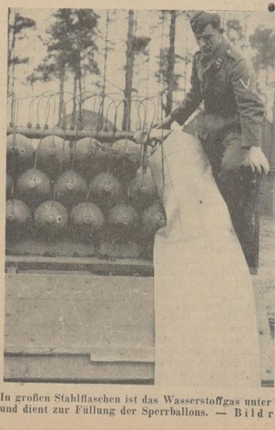
In großen Stahlflaschen ist das Wasserstoffgas unter einem Druck von fast 200 Atmosphären eingeschlossen und dient zur Füllung der Sperrballons. — Bild rechts: Ein Ballon wird zum Aufstieg fertiggemacht.