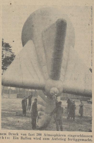
In großen Stahlflaschen ist das Wasserstoffgas unter einem Druck von fast 200 Atmosphären eingeschlossen und dient zur Füllung der Sperrballons. — Bild rechts: Ein Ballon wird zum Aufstieg fertiggemacht.