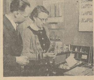
Die künftige Drogistengehilfen mitten in der Chemisprüfung.