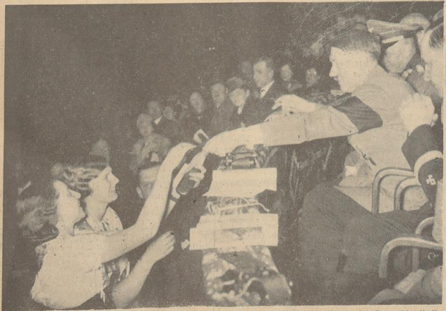
Mit dem Besuch des Führers erreichte das Internationale Rot- und Fahnenjourné in der Deutschlandhalle seinen Höhepunkt. Immer wieder wurde der Führer um seine Unterschrift gebeten.

M.Z. meldet: Wie die Sowjetregierung am Donnerstagmittag dem ungarischen Gesandten in Moskau mitteilte, beobachtet sie, die Budapest-Gesandtschaft zu schließen und eine in einem anderen Staat tätige Gesandtschaft zu betreiben, sei bei der ungarischen Regierung zu vertreten. Die ungarische Regierung trifft dementsprechend Maßnahmen zur Schließung der Moskauer Gesandtschaft.