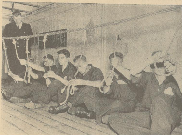
Geschickte Hände gehören zum Lösen dieser Aufgabe, die hier die Prüflinge auf dem Ausbildungsschiff „Admiral Brommy“ der Wettkampfstätte in Bremer Hafen, ausführen.

Eine Aufgabe aus dem Reichsberufswettbewerb der Seeleute