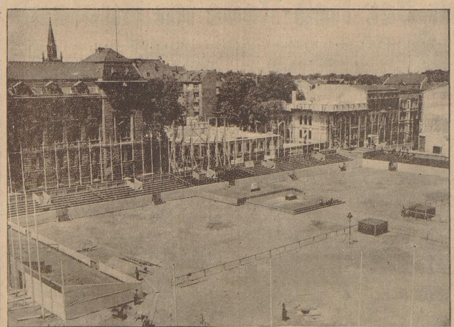
Hier gibt der Führer das Startzeichen zum Arbeitsbeginn der Umgestaltung der Reichshauptstadt. Blick auf den Runden Platz an der Potsdamer Straße, wo der Führer heute den Grundstein für das Haus des Deutschen Fremdenverkehrs legt.

Soweit aus der Slowakei Berichte vorliegen, hat die Karpatendeutsche Partei Konrad Henleins ihre Stimmkraft gegenüber dem Ergebnis der Parlamentswahlen vom 1935 in einem ungewöhnlichen Maße heigern können. In der überwiegenden Zahl der Gemeinden ist sie verdoppelt und verdreifacht worden.