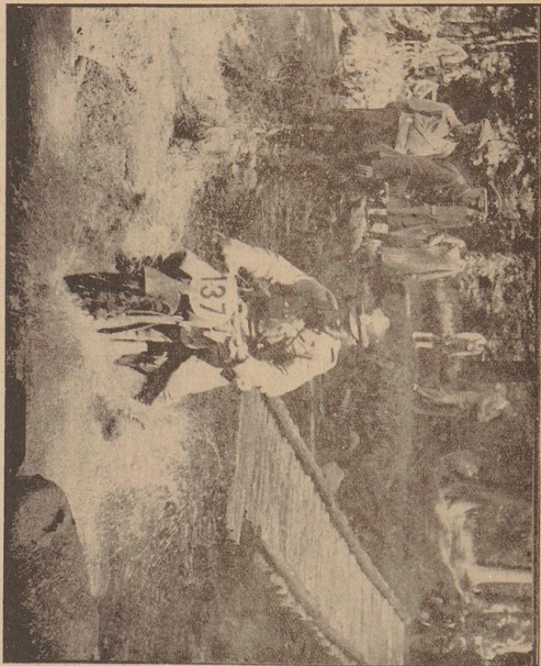
Hochspritz des Wasser auf, wenn man so mit einem „Schnorr“ in den Becken reinkommt! Ein Udermarksfahrer, der die Udermarksfahrt in der Udermark gemacht hat, hat die goldene Plakette erhalten.

Die Mannhaftigkeit des Bannes liefen erhielt die goldene Plakette