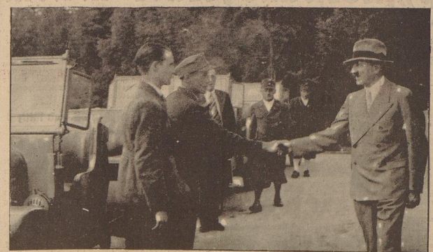
Der Führer hilft der Bergwacht. Das schwere Bergsteiger-Unfall an der Watzmann-Ostwand im Januar 1937, bei dem ein Gelände-Kraftwagen erfolgreich eingesetzt wurde, veranlaßte den Führer zu der hilfreichen Maßnahme, der deutschen Bergwacht vier dieser Wagen zum Geschenk zu machen. Die Wagen haben Vierachslertrieb und Vierradlenkung. Außerdem ist der eine Vordersturz so umzulegen, daß er in Verbindung mit dem rückwärtigen die Tragfläche für eine Bahre ergibt. — Unser Bild: Der Führer begrüßt Männer der Deutschen Bergwacht, denen er in der letzten Woche auf dem Berghof die Wagen übergab.

Weihenolle Klänge von Brahms, zu Gehör gebracht vom Direktor des Staatstheaters, leiteten zu der Begrüßungsansprache des Gauleiters Horster über. Er hieß den Minister als den unwertigsten Förderer der deutschen Kunst auf das herzlichste willkommen. Unter langanhaltendem Beifall teilte Horster mit, daß künftig auf den Gaukulturwochen 10.000 Gulden für die besten künstlerischen Leistungen des Jahres zur Verteilung kommen werden. Als äußeres Zeichen des innigen Dankes für das feste Interesse an allen Leistungen der Stadt überreichte der Gauleiter dem