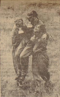
BDM-Mädel bei praktischen Übungen.