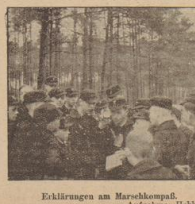
Erklärungen am Marschblock.