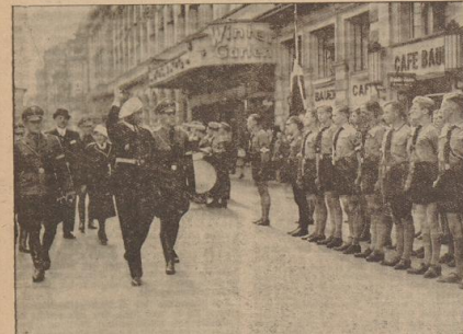
Auf dem festlich geschmückten Bahnhof Friedrichstraße in Berlin...