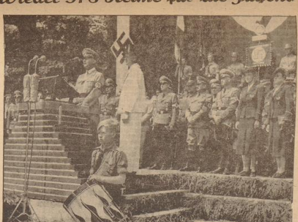
In allen Gauen des Reiches wurden, wie gewohnt, am Sonntag...