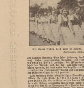
Mit einem frohen Lied geht es hinaus.