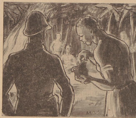
Der Hauptling nimmt das Säckchen und öffnet es. Im Feuerlicht leuchtet das Gold. (Zeichnung: Rieger)

zu seinem Väter. „Schade, daß man gerade mich aufgehängt. Ich bin der einzige Weiße, der den Eigentümer des zweiten Cullinan kennt.“