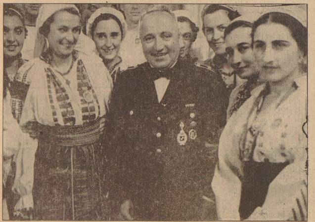
Reichsleiter Dr. Ley mit französischen Frauen in ihren Trachten an Bord des „Wilhelm Gustloff“ (Bericht siehe im Inneren des Blattes)

Die spanische Regierung hat dem deutschen Volkshatler in Valencia aus Anlaß der Wiederkehr des Tages, an dem vor einem Jahr der feige Angriff spanischer Panzer auf die „Deutschland“ erfolgte und zahlreiche Opfer an deutschen Reichsdeutschen forderte, ihr Gedächtnis ausgesprochen und um entsprechende Unterstützung der Reichsregierung gebeten. Der deutsche Volkshatler ist beauftragt worden, den aufrichtigen Dank der Reichsregierung für die erwiesene Anteilnahme auszusprechen.