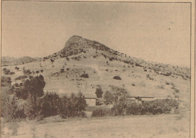
Eingang zu einer Farm

Und jetzt ist es soweit. Die Weideweiler werden geöffnet. Alle schwarzen Viehtreiber, Kaffern, kleine, rundköpfige Omasos, breitgesichtige, gelbbäutige, asiatisch anmutende Hottentotten oder großgewandene, stolze Hereros sind eingetroffen, ohne Gile. Aber sie sind da. Jeder steht bei seiner Herde. Der um Loh öffnet sich, und langsam treibt der Hirte seine Tiere am schließenden Ende oder an seinen weißen Angestellten vorbei. Das Gähnen von Vieh ist eine Sache, die man unter feinen Umständen den farbigen überlassen kann. Und auch ein Weiße muß sich da hinstellen, wenn Schafe die schlechte Gewohnheit haben, sich manchmal zum Zusammenstoßen. Einmal kommen sie einzeln, dann wieder in Massen, einige zuden hintereinander aus. Besonders die Klammern, die stolzen Wäpfer und Beherrscher der Herden, glauben ihrer zugehörigen Männlichkeit besonders ungeschont und Wackelhaftigkeit schuldig zu sein. Endlich sind sie alle drängen und ziehen ihren Weg, die Schafe, die Rinder, die Herde. Ihre schwarzen Hirtinnen nähern sich dem Sas und ditten um die Bescheinigung ins Buch. Dieses