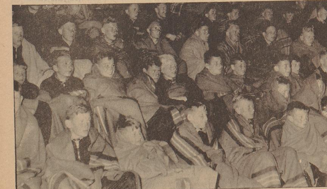
Die bis tief in die Nacht währende große Freilicht-Filmstunde in der Bremer Kampfbahn sah bei aller mitternächtlichen Kühle, der hier mit Decken begegnet wird, eine gespannt folgende Zuschauerbesetzung.