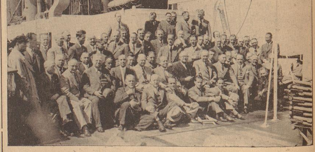
Die Schweizer Gäste mit ihren Gastgeberinnen am Bord des „Roland“.