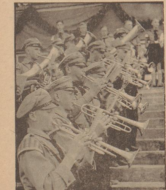
Neben den Sportvorführungen verschiedenster Art gaben in der Bremer Kampfbahn auch die Musikzüge einen Abschnitt aus ihrer praktischen Arbeit.

Es handelt sich um einen aus Eisenblech gefertigten Flug, der im Kreise durch nur wenig über dem dünnen Lande im Moor gefunden wurde. Er gehört zum Typus der Hakenpflüge und ist der älteste Flug der Welt. Eindeutig wird durch die Auffindung