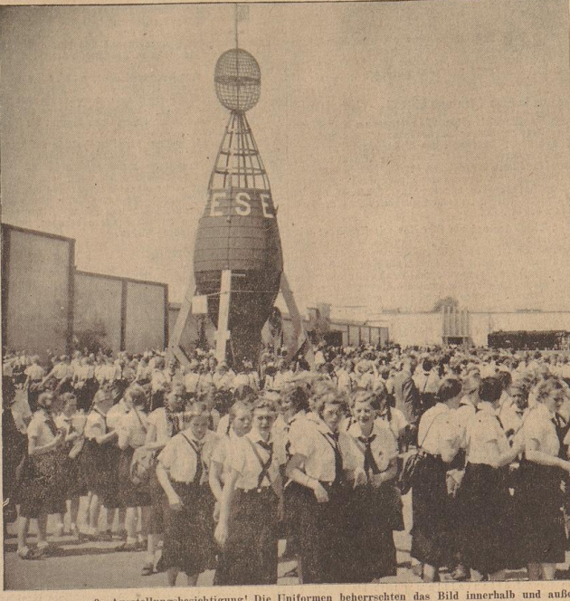
Gestern war große Ausstellungsbesichtigung! Die Uniformen beherrschten das Bild innerhalb und außerhalb der Hallen.

Die Reichsbeauftragte ging dann näher auf Fragen der Arbeitseinteilung ein. Die im BDM-Werk „Glaube und Schönheit“ zusammengeführten Mädeloberstufen werden einmal weniger in der Woche den eigentlichen BDM-Dienst machen und dafür an einem zweiten Abend in ihren verschiedenen Arbeitskreisen zusammenkommen. Diese Arbeitsgemeinschaften werden unter den verschiedensten Gesichtspunkten leben, je nach Neigung und Begabung der Mädel: Leistungssport (worumer nicht Notwendigkeit zu bestehen ist), vor allem Gymnastik nach den Anleitungen Friedrich Webaus, Volkstanzarbeit, die eine besonders