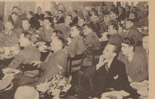
Die erste Feierstunde im Kreis der neuen Arbeitskammern