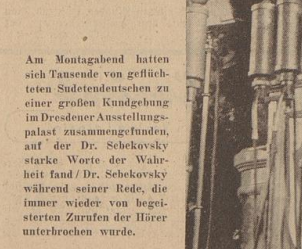
Am Montagabend hatten sich Tausende von tschechoslowakischen Sudetendeutschen zu einer großen Kundgebung in Dresden versammelt.

Das kam, das große der verarmten und verdrängten tschechoslowakischen Bevölkerung weit mehr öffentliche Kosten als den tschechoslowakischen Bevölkerung auferlegt wurden. Kosten, die in erster Linie bei der tschechoslowakischen tschechoslowakischen Wirtschaftswirtschaft zu tragen kamen. Diese wenigen Beispiele mögen genügen, die tschechoslowakischen tschechoslowakischen Methoden der Prager Machthaber gegenüber dem Sudetendeutsche zu kennzeichnen.