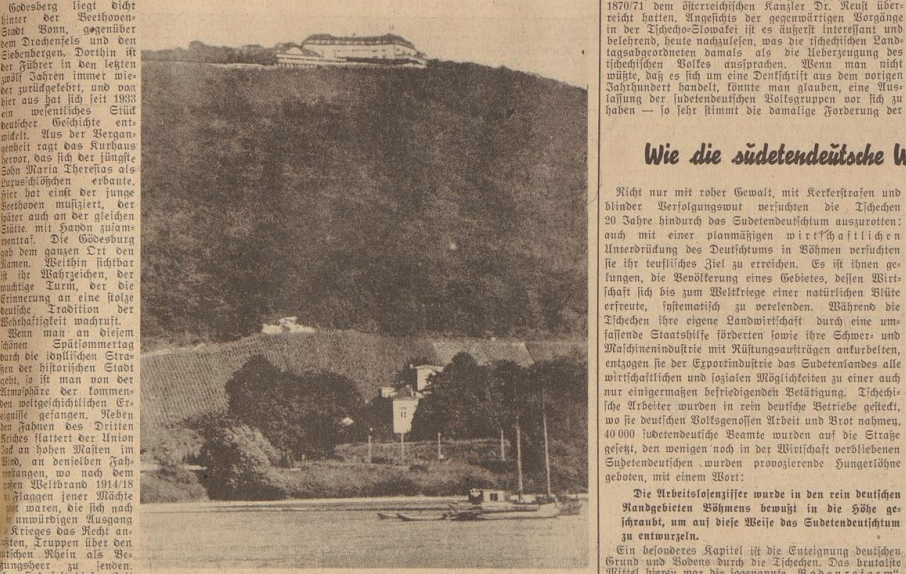
Kurhotel Petersberg bei Bad Godesberg, das Quartier Neville Chamberlains