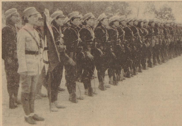
Chinesische Amazonen. In chinesisch-japanischen Krieg sind jetzt auch chinesische Frauen-Kompanien gebildet worden, die in Ausrüstung und kriegerischem Einsatz den Männern vollkommen gleichgestellt sind.