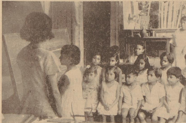
Alle Rassen sind hier vertreten: Vom Hellbraun bis Schwarz, von rotblühigen Indianerbluten bis wallhaarigen Negerkindern. Die Professora braucht weder ein Staatsexamen noch sonst eine abgeschlossene Bildung, wenn sie unterrichten will. Sie ist oben die Frau am Fluß, die gerade lesen und schreiben kann. Sie malt Wörter und Sätze an die Tafel, und die Kinder malen so lange nach, bis ihre Malerei der an der Tafel gleicht. Induktive Methode...

Dorthin gehen — nein fahren — die Kinder der benachbarten Pfanzler in die Schule. Von frühester Kindheit an mit den Tiden des Stroms vertraut, losgelassen mit dem Ruderblatt in der Hand geboren, ist für sie die tägliche Besfahrt, die hin und zurück oft über fünf Stunden dauert, nichts Besonderes. So gleiten sie lustig schwebend an der Urmalldauer entlang, die drüben über ihnen ins Unendliche wächst und das Raum mit den Kindern als Spielzeug erscheinen läßt. Der Schulturm ist primitiv, wie die ganze Hütte, primitiv wie die Schulmappe, die einfache Holztafel sind. Im einzigen Raum der Hütte werden ein paar Bänke in die Mitte gerast, vor sie eine Tafel gestellt, der Unterricht kann beginnen. Wertmäßig wie die Kinder das Schreiben lernen, nicht die Buchstaben einzeln, sondern gleich ganze Sätze... die die Professora an die Tafel