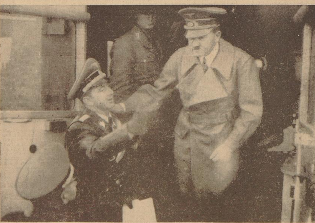
Der Führer besichtigt den Pressetankwagen. Bei den kürzlichen Truppenübungen im Südenland besichtigte der Führer mit Reichspresschef Dr. Dietrich den motorisierten Pressetankwagen, der ihn auch auf der Straße und im Gelände ständig mit den politischen Ereignissen in Verbindung hält.

In der Elbminbung kam es zu einem Schiffszu- sammenstoß.