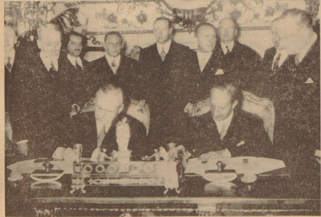
Ein Dokument guter Beziehungen zwischen dem Deutschen Reich und Frankreich wurde am Dienstagmorgen — wie gemeldet — durch Reichsaußenminister von Ribbentrop (links) und dem französischen Außenminister Bonnet (rechts) am Quay d'Orsay unterzeichnet.