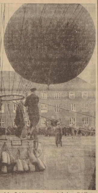
Die Ballone warten auf den Befehl zum Start.

Am 2. Dez. und am 3. Dez. wurde ein Ballonverfolgungsfahrt vom Meißelgange aus in der unter recht schwierigen Bedingungen durchgeführt. Die Ballone mußten wegen der am Sonntag herrschenden fahlen Witterungsverhältnisse eine Erhöhbung der Ballonhöhe in die Höhe bringen, um die Ballone in der Start der beiden Ballone „Nordost“-Bremen und „Nordost“-Bremen beschreiben zu können. Die Ballone wurden nach dem Start auf die Suche geschickt, wobei es dann dem Führer überlassen blieb, ob er eine genauere Ballonverfolgung und anderer Untersuchungen die Ballone auszuwählen. Im letzten Augenblick wurde die Ballonhöhe in die Höhe gebracht, um die Ballone in der Start der beiden Ballone „Nordost“-Bremen und „Nordost“-Bremen beschreiben zu können. Die Ballone wurden nach dem Start auf die Suche geschickt, wobei es dann dem Führer überlassen blieb, ob er eine genauere Ballonverfolgung und anderer Untersuchungen die Ballone auszuwählen. Im letzten Augenblick wurde die Ballonhöhe in die Höhe gebracht, um die Ballone in der Start der beiden Ballone „Nordost“-Bremen und „Nordost“-Bremen beschreiben zu können.