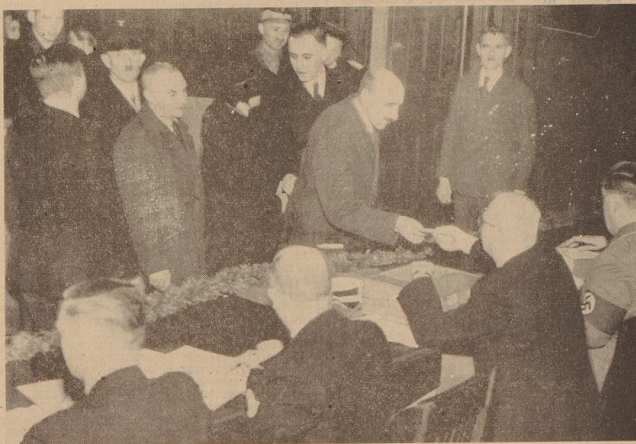
In den Vormittagsstunden herrschte Hochbetrieb ...

Mit einer Einmütigkeit und Geschlossenheit, wie sie bisher noch bei keiner Wahl und bei keiner Volksabstimmung zu verzeichnen war, bekannten sich gestern die in Bremen wohnenden Wahlberechtigten zu sudetendeutscher Ergründungswahl und zu Großdeutschesland. 1367 Personen waren in Bremen wahlberechtigt, und sie alle gingen treulos an die Wahlurne. Ohne große Werbung, nur getrieben von ihrer Liebe zum Vaterland und vom Bewußtsein, die ihnen schuldigen, von diesen 1367 Wahlberechtigten gaben 1362 Wähler — das sind 99,671 Prozent — ihre Stimme dem Führer, nur fünf von der großen Zahl der Wahlberechtigten — unter denen sich bekanntlich auch hier anständige Tüchtlinge befinden — stimmten mit Nein. Das ist ein Ergebnis, das einmalig ist und das auch von jenen allerorten Deutschen des Altreiches bemerkt werden muß, die bisher noch nicht die innere Verbündung zum neuen Deutschland fanden.