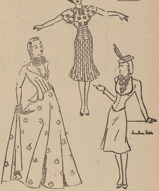
Links: Zum sommerlichen Abendkleid eine Jacke aus Waschseide mit Schößen, dessen Linie durch schwarze Valenciennespitzen betont wird. Garitur: schwarze Spitzenblüten. Mitte: Interessante Verarbeitung eines Frühjahrskleides (gemusterter Reliefstoff) mit Hutfarbe durch Querfalten. — Rechts: Kostüm aus braunem Velour mit der neuartigen kurzen Westenjacke; Tüllweste mit plastischen Blüten.

noch von der Modenschau der Münchener Mode-Akademie in Bremen