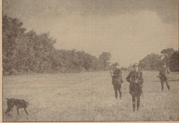
Deutsch Drahtlarväre „AB vom Uhlensuch“ Zb. DD 12.214 zeigt sicheres Vorstellen.