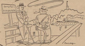
Sagten Sie sechs? Nein — ich sagte 3!