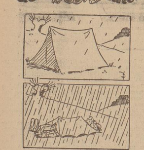
Das Lachen, das im Regen einfließt