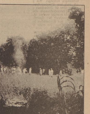
Die Gäste vom „Hotel Teehaus“, die Sträflinge, beim „Arbeiten“.

Die Kerle, die den Mann hier hindurch netzte, sind die Kerle, die den Mann hier hindurch netzte, sind die Kerle, die den Mann hier hindurch netzte. Die Kerle, die den Mann hier hindurch netzte, sind die Kerle, die den Mann hier hindurch netzte, sind die Kerle, die den Mann hier hindurch netzte. Die Kerle, die den Mann hier hindurch netzte, sind die Kerle, die den Mann hier hindurch netzte, sind die Kerle, die den Mann hier hindurch netzte.