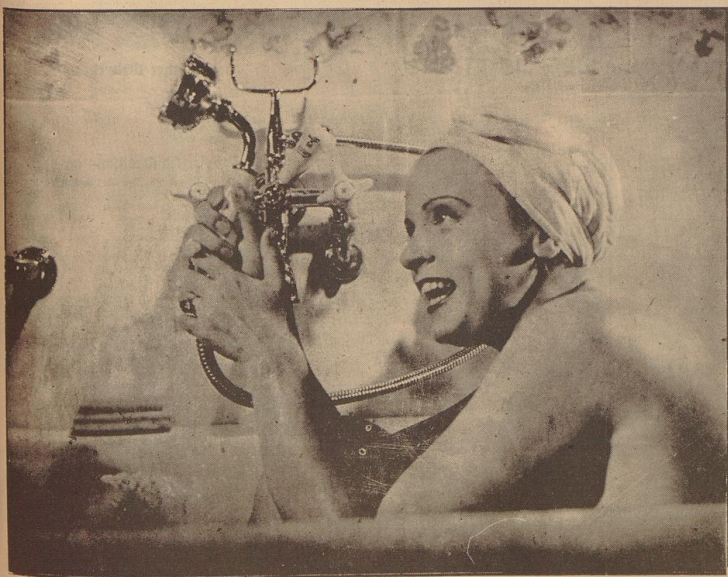
LUISE ULLRICH in dem Meteorfilm der Tobis „Ich liebe dich“.

Wie kam C. G. zum Exposé? Wie wurde er zum Regisseur, geschweige gar zum großen Star? Geduld, Geduld...! Durch Kaiser-Huld: „Napoleon ist an allem schuld!“ Zuz.