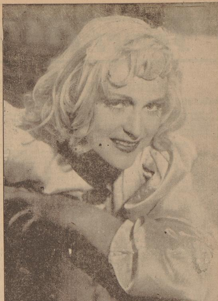
In dem Film „Fahrendes Volk“ spielt neben Hans Albers, Hannes Stelzer und Françoise Rosay auch Camilla Horn eine tragende Rolle.