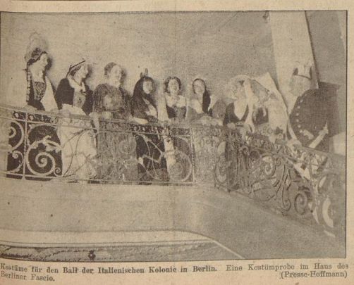
Kostume fur den Ball der Italienischen Kolonie in Berlin. Eine Kostumprobe im Haus des Berliner Faschis. (Presse-Hoffmann)

Paris, 24. Januar. Die Pariser Presse erortert das Auftreten der Kommunisten gegen das neue franzosische Kabinett. Die Kommunisten haben sich gegen das Kabinett ausgesprochen, obwohl sie es einstimmig gebilligt hatten. Sie wettern gegen die Politik des Kabinetts und fordern die Abkehr von den franzosischen Interessen.