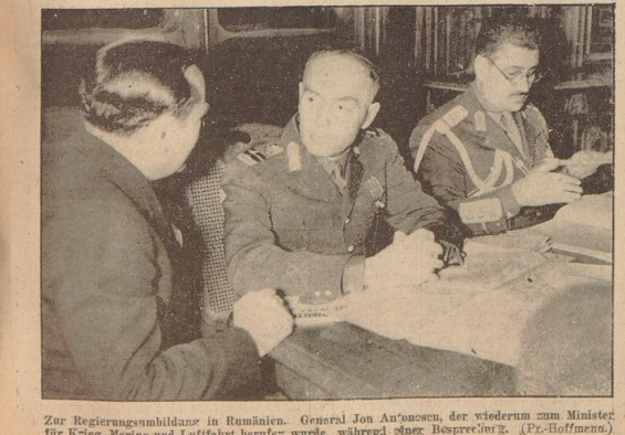
Zur Regierungsbildung in Rumänien. General Ion Anononescu, der wiederum zum Minister für Krieg, Marine und Luftfahrt berufen wurde, während seiner Besprechung.

Was habe man aus dem Ansehen Frankreichs gemacht? Frankreich sei heute nichts anderes als ein Stein auf dem Schicksalsteil, aus dem fremde, ausländische Hände aus dem Schicksal Frankreichs spielten. 'Frankreich erwache!', rief Flandin wiederholt aus. Frankreich müsse nicht länger ertragen, daß das Ausland ihre Veränderungen schmeide, wodurch die eine Hälfte des Volkes gegen die andere gehet werde; es möge sich nicht in den nächsten Krieg schicken lassen, denn man ihm als unermittlich hinstelle. Es sei nicht mehr die Stunde der Parteien — noch der parlamentarischen Kabinettsverbindungen, sondern es sei die Stunde des Volkes.