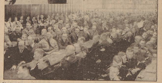
Die Aerztinnen und Aerzte des Gebietes hörten in dem oberen Saal des Gewerhauses die anschließenden Darlegungen des Reichsarztes der HJ.