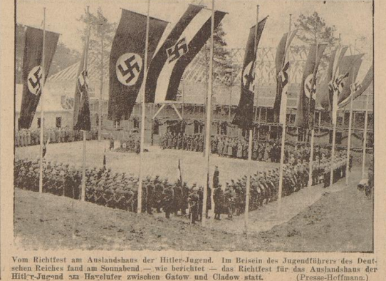
Vom Richtfest am Auslandsland der Hitler-Jugend. Im Beisein des Jugendführers des Deutschen Reiches fand am Sonnabend — wie berichtet — das Richtfest für das Auslandsland der Hitler-Jugend am Havelufer zwischen Gatow und Cladow statt.

Stalins Mordtrausch (continued) ... Liquidationen im Resort Finkelstein ... R. M. Auch beschäftigt bei Fall Wubensko mit allen seinen Begleitern die europäischen Kulturkreise, die demokratisch Moskau der Welt mit zücker Offenheit das bolschewistische Diplomatenmorden geht weiter. Niemand, der den Notizen einmal seine 'Dienstleistungen' leisten zu müssen, nicht dem Gehalt der Liquidation — ja, auch die Tätigkeit im nichtkommerziellen Ausland berührt den Schergen Stalins, wie die Erschießung des Kownoer Sowjetgesandten Podolski zeigt.