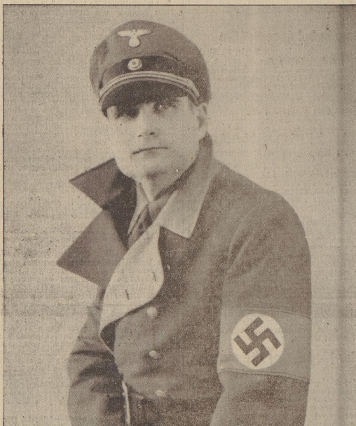
Der Stellvertreter des Führers, Reichsminister Rudolf Heß, vollendet heute sein 44. Lebensjahr.

Die Tiroler, die Steiermärker und die anderen Stämme unserer deutschen Dornmark lieben ihre Heimat und dienen dem Reich; ihnen jagt der Begriff „Österreich“ nichts mehr. Ihre Liebe gehört ihrer Heimat und ihre Herz, ihr Sinn gehört Deutschland. Zwischen diesem engeren Begriff der Heimat und dem größeren des Reiches kennt und will sie keine Grenzen. Dieser tiefsten Forderung der Deutschen in der Dornmark politische Erfüllung zu geben, das ist die große Aufgabe sein, für die Gauleiter Bürckel zum Führer Auftrag und Vollmacht erhielt. Wir kennen die inneren Grundprinzipien der nationalsozialistischen Partei. Das Prinzip der inneren Überwindung künstlicher Gebilde, wie sie etwa Völkernationen im Namen des deutschen Volkes darstellen, ebenso wie das Prinzip der Überwindung des jüdischen Zentralismus anderer Staaten durch die Stärkung der inneren Kräfte, die heute im Reich in den Gauen der NSDAP zu neuem Leben erweckt worden sind. Die Persönlichkeit Gauleiter Bürckels, der an all die großen Aufgaben, die der Führer ihm bisher gestellt hat, mit eben so großer Entschlossenheit wie nationalsozialistischem Weltanschauung herangegangen ist, bietet den Deutschen der Dornmark die Gewähr für eine klare und erfolgreiche Lösung der geistlichen Aufgabe der Wiedervereinigung Österreichs mit dem Deutschen Reich. Die innere politische Sicherung unseres Reiches, nicht nur dem Dornmark, sondern auch dem Geist nach.