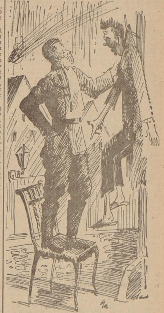
... und hing den Barbier an einen großen Mauerhaken an

„Dabei ist er erst knapp 21 Jahre alt. ... Man hat ihm die glänzenden Bekleidungen gemessen. Eine unerhört große militärische Karriere hätte ihm offen. Selbst der Zar ist bereit, den jungen, mutigen Offizier