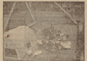
Oben und links unten: Eine Stockente mit ihren 12 eigenen und 30 gleichaltrigen Pflückerkücken. — Rechts unten: Der jüngste Stolz des Züchters. Ein eigenes Küken der Entenmutter, die sich als vorzügliche kleine Betrügerin von fremden Küken erweist.

mühe dieser billige, fast ohne Körnerfutter erzeugte Gänsebraten eben so wie zu Weidenden. Auch die Aufzucht von Enten kann viel mühseliger sein. In diesem Fall hat das Festmachen wieder in anderer Weise zu geschehen: man schlägt zwei Ringe an den Schmalleiten ein, die mit einem Draht verbunden sind. Auf diesen kommt ein beweglicher Ring, an dem die Jiege festgehalten, befestigt wird. Dann hat sie noch in der Länge einen zentralen Spielraum, nicht aber in der Breite.