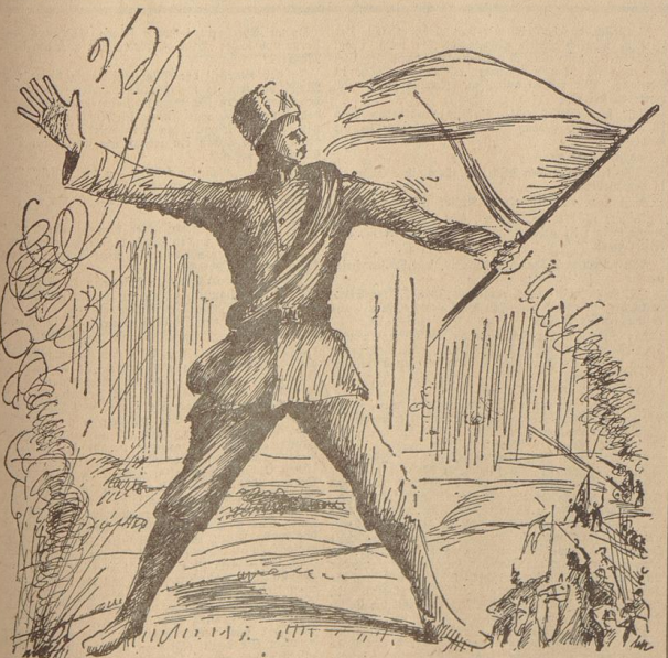
... da erhebt er sich plötzlich mitten auf dem Hügel, steht da, groß, schmal, breitbeinig, schwingt eine kurze russische Waffe in den Händen. Zeichnungen: Eckstein (2).

Am Ende des Old Cell House erstet sich in leuchtendem Rot ein moderner Ziegelbau, der über 300 000 Dollar gekostet hat. Hier sind die „Gonnamend Cells“, 27 Zellen lang, 6 bis 12 Meter hoch, 6 bis 12 Meter breit und 6 Zellen der „letzten Minuten“. Die Gefangenen bezeichnen dies als „die dancing rooms“ — die Tanzsäle, wofin am Morgen der Strindungsfrage die Delinquenten gebracht werden. In diesen Zellen vorerst jeder ein Korridor zu einer Tür, über der groß und nachend: „Auge“ steht. Hier steht der „Electric chair“, der elektrische Stuhl, und man bringt hier nicht mehr Zellen über an der Wand trägt die mehr als 300 Namen der bisher Hingerichteten.