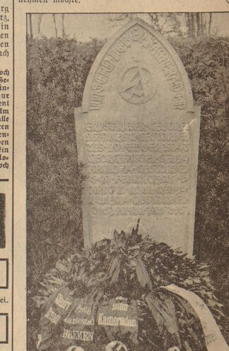
Der Grabstein für die drei der in Bremen auf dem Osterhof Friedhof beigesetzten Angehörigen der Österreichischen Legion. Aufn.: Sommer

St. Petri-Domkirche: Gastpredigt Pastor Wagner, Berlin, am Sonntag, dem 21. April, 10.15 Uhr. Gastpredigt Professor Dr. Eißler, Münster, am Mittwoch, dem 27. April, 10. Uhr, auch unter Mitwirkung des Domorgans. Gastpredigt Pastor Riese, Pastor am Dom, am Sonntag, dem 8. Mai, 10.15 Uhr.