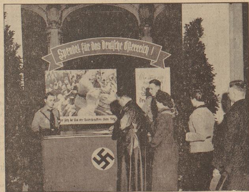
80 000 RM. ergab schon der gestrige Tag ...

Am heutigen Geburtstag des Führers ruft das Winterhilfswerk zur Unterstützung der durch die Entlassung der durch die Entlassung in Not und Elend geratenen Brüder in der deutschen Heimat auf. Am Führer, der in den letzten Jahren schon oft Beispiele einmütiger Opfersbereitschaft gezeigt hat, wird auch diesmal faktisch bezeugen, wie sehr er den Führer die in den historischen Märtyrern vollzogene unerschütterliche Wiedervereinigung der deutschen Völker mit dem alten Reich dankt. Spende für das deutsche Österreich heißt die Spende des Tages, und wer schnell hilft, hilft doppelt. Einzahlungen auf das „Konto Österreich“ nehmen alle Dienststellen des WSW, sämtliche Banken und die Sparkassen in Bremen (mit sämtlichen Nebenstellen) entgegen, die bereits gestern einen Spendenbeitrag von rund 80 000 Mark ausweisen konnte. Anlässlich des heutigen Opfertages hat die Sparkasse im Rahmen der Hauptstelle am Freitag einen von 3. Kärtmann entworfene Einzahlungsscheck entworfen, der sich im Not des Führertags und im Grün der Lorbeerzweige feierlich und wirkungsvoll ausnimmt.