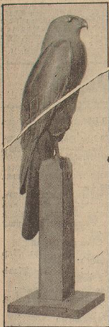
Eine Bronze von Krüger: „Speerbohrer“

Die Reichswaltung der NSD. hat bekanntlich seit dem Dezember 1936 ein Hilfswerk für die bildende Kunst eingerichtet, das in allen deutschen Gauen Kunstausstellungen veranstaltet. Am Sonnabend findet eine solche Ausstellung auch in Bremen eröffnet, zu der die Vorbereitungen in vollem Gange sind. Hier bieten Gelegenheit, mit dem Vertreter der Reichswaltung über das Hilfswerk zu sprechen und können darüber folgendes berichten: