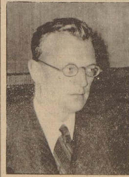
Dr. Seyß-Inquart

Wie von zuständiger Stelle mitgeteilt wird, findet der Stapellauf des zweiten Adz.-Schiffes am heutigen Sonnabend nicht statt. Der genaue Zeitpunkt des Stapellaufes und die Benachrichtigung über den endgültigen Termin werden rechtzeitig mitgeteilt. Der Führer wird zum Stapellauf anwesend sein.