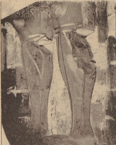
Die Waden des Rolands aus der Nähe betrachtet decken die schwere Bruchfläche, hervorgerufen durch die rostenden Dolben, in ihrer ganzen Schwere auf.

— und an derselben Stelle von Grund auf neu errichten — Beginn der Arbeiten in aller Eile