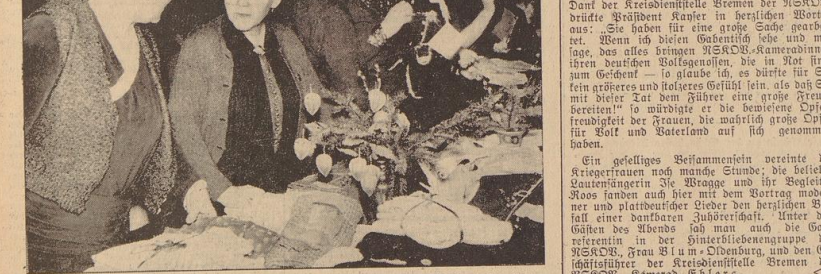
Auf blumenreichen Tischen ausgebreitet liegen die Zeugnisse fleißiger Hände. Aufn.: Sommer

Die allmonatliche Kameradschaftliche Zusammenkunft der Kriegerveteranen am Freitagabend fand am Freitagabend im großen Saal des Kaffeehauses statt. Am Freitagabend fand im großen Saal des Kaffeehauses statt. Am Freitagabend fand im großen Saal des Kaffeehauses statt.