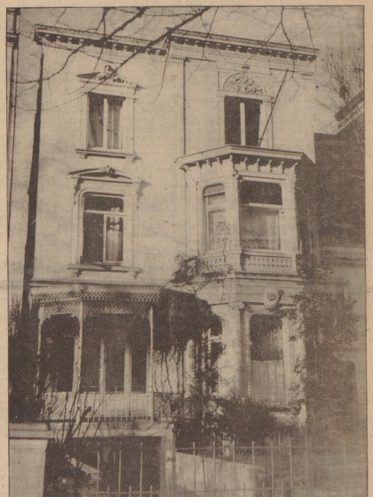
Das Haus in Hamburg, in dem sich das Sowjet-Generalkonsulat befindet.

Die Sowjetunion will offensichtlich das sowjetrussische Volk, das durch die Einfuhrverbote für Lebensmittel, Filme, Schallplatten und durch das Verbot von Auslandsreisen schon abgedrückt von der übrigen Welt abgegrenzt ist, völlig aus der Verbindung mit dem Leben der Welt herantrennen. Der Grund für dieses allen internationalen Gespinnstereien widersprechende Verhalten ist leicht ersichtlich, denn eine Verbindung mit der internationalen Welt würde das Ende der roten Herrschaft in Moskau bedeuten, die das russische Volk glauben machen will, es lebe im Protektorat-Paradies auf Erden. Moskau brüht die Bande mit der Außenwelt auch organisatorisch, nachfolgend hat das rote Innenministerium mit der Kulturarbeit begonnen, werden können. Später dieser heimtückischen Planer kann Stalin sein Zerkünderwerk am 10. ungeheuerlich fortsetzen.