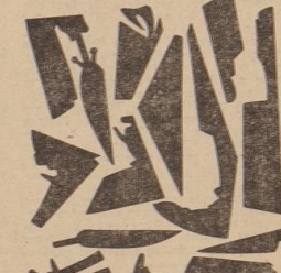
Schraub' aus die Teile und löst' sie? Dann löst' Du Duffel Raub'.