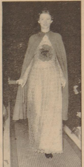
Ober: Abenbild aus weicher Hochschalmeide in sparrer Schallfäden. Nebenste hundert: Von links nach rechts...