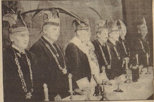
Der „jocke“ Elferrat, unter dessen lustigem Regiment der Seemannsfeierabend zu einem fröhlichen Fest wurde.

Worte entnommen: „Solange und bis und das noch länger — soll uns heute Abend fern... Der Verein der Rheinländer brachte mit seinem Elferrat echte rheinische Kameradschaft