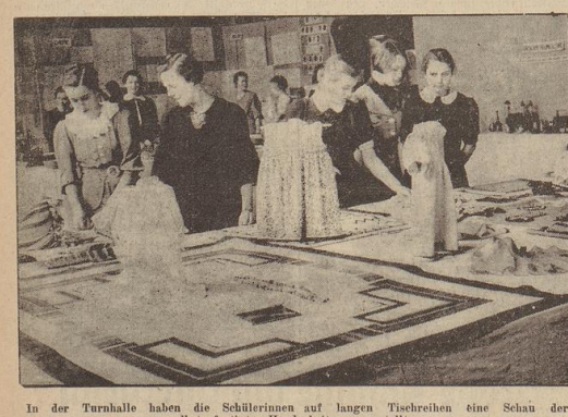
In der Turnhalle haben die Schülerinnen auf langen Tischreihen eine Schau der selbstgefertigten Handarbeiten ausgestellt.

Schülerinnen-Ausstellung in der Oberschule Kastelfraße