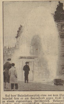
Nach dem Bahnhofsvorplatz etwa vor dem Floßbahnhof kam es am Samstagabend gegen 15.40 Uhr zu einem eigenartigen Zwischenfall. Bekanntlich meckert hier augenblicklich Straßenbauarbeiten

ausgeföhrt. Die Bauarbeiter haben das in ihrer Arbeit... Ein unerwünschter „Springbrunnen“