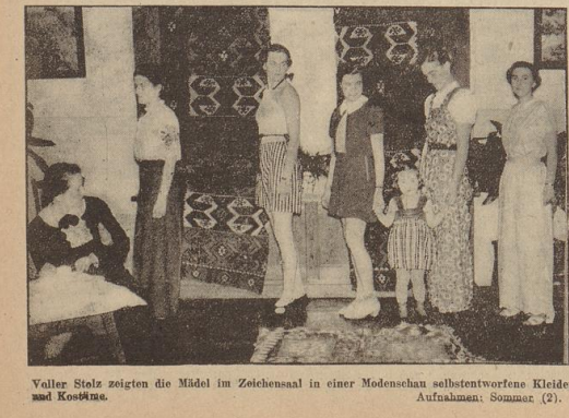
Voller Stolz zeigten die Model in Zeichensaal in einer Modenschau selbstverwirklichter Kleider und Kostüme. Aufnahme: Sommer (2).

ausgeföhrt. Die Bauarbeiter haben das in ihrer Arbeit... Ein unerwünschter „Springbrunnen“