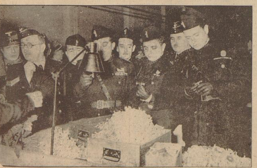
Anlässlich des Besuchs einer Abordnung von elf Angehörigen der Faschistischen Industrie-Arbeiter-Konföderation unter Führung des Vizepräsidenten Commodore de Ambris in der Reichshauptstadt, wurde der NS-Musterbetrieb Stock & Co. in Marienfeld besucht. (Presse-Hoffmann.)

Tokio, 13. Februar. Die japanische Regierung hat die Noten Englands, Frankreichs und Amerikas beantwortet, in denen die Staaten eine verbindliche Erklärung Gaps bis zum 29. Februar verlangen, daß es keine Schlachtschiffe über 35 000 Tonnen baue. Die japanische Regierung erklärt in ihrer Antwort, daß sie nicht in der Lage ist, dem Wunsch nach Begrenzung ihres Flottenbauprogramms zu entsprechen.