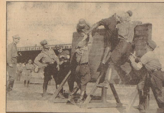
Die Wiederholungsübungen für das SA-Sportabzeichen beginnen. Unser Bild zeigt Männer an der Eskalatorwand.