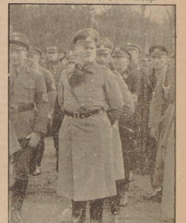
Chef des Oberkommandos der Wehrmacht Keitel.