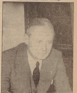
Reichsaußenminister v. Ribbentrop.