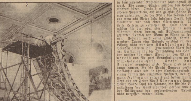
O b e n : Der farbige „Himmel“ Tabu Tongas wird mit viel Mühe angepaßt.

Tabu-Tonga-Funke aus Papier und Laune für insgesamt vier große Feste in den Centralhallen