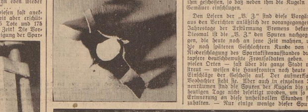
Die letzte im Foto-Museum erhalten gebliebene Erinnerung an die Kämpfe im Weltkrieg wurde gefürmt...