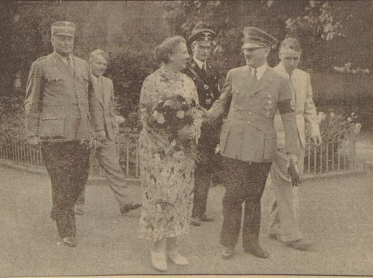
Der Führer in Bayreuth. Am Donnerstagnachmittag traf der Führer und Reichskanzler zum Besuch der Festspiele in Bayreuth ein.