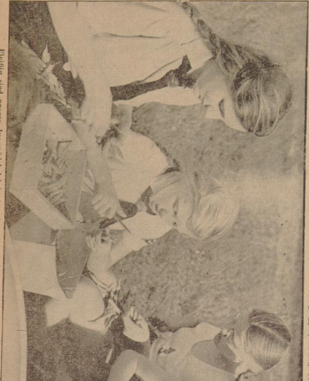
Freudig sind unsere Jungmädel dabei, ein schmackhaftesessen zu bereiten

Die alten Schule hat eine lange Geschichte. Sie hat sich im Laufe der Jahrhunderte entwickelt und ist heute ein wichtiger Bestandteil der Erziehung. Die alten Schule hat eine lange Geschichte, und es ist die Aufgabe der Erziehung, sie zu erhalten. Die alten Schule hat eine lange Geschichte, und es ist die Aufgabe der Erziehung, sie zu erhalten.