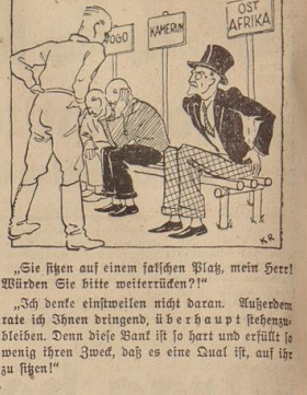
„Sie sitzen auf einem laischen Platz, mein Herr! Was den Sie bitte weiterdrehen!“

Die Kolonialfrage ist ein Thema, das die Aufmerksamkeit der Öffentlichkeit auf sich zieht. Die Regierung muss Maßnahmen ergreifen, um die Kolonialfrage zu lösen. Die Bevölkerung ist interessiert an den Meinungen der Beteiligten zu diesem Thema.