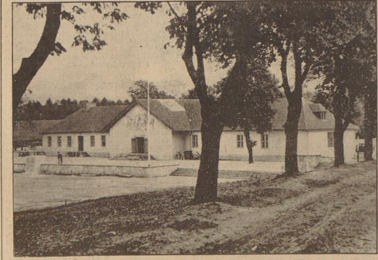
Adolf-Hitler-Weihstättchen Pasewalk. Das ehemalige Kriegs-Lazarett in Pasewalk (Pommern), in das der Führer am 21. Oktober 1918, durch eine Gasvergiftung nahezu erblindet, eingeliefert wurde, ist jetzt, wie berichtet, in eine würdige Weihstättchen der nationalsozialistischen Bewegung umgewandelt worden.

Die „frühdienstliche Tageszeitung“ erinnert in einem ausführlichen Artikel daran, daß am gestrigen Mittwoch 15 Jahre vorangegangen sind, seit Julius Streicher die erste Dringungsgruppe der Bewegung in Nürnberg gründete.