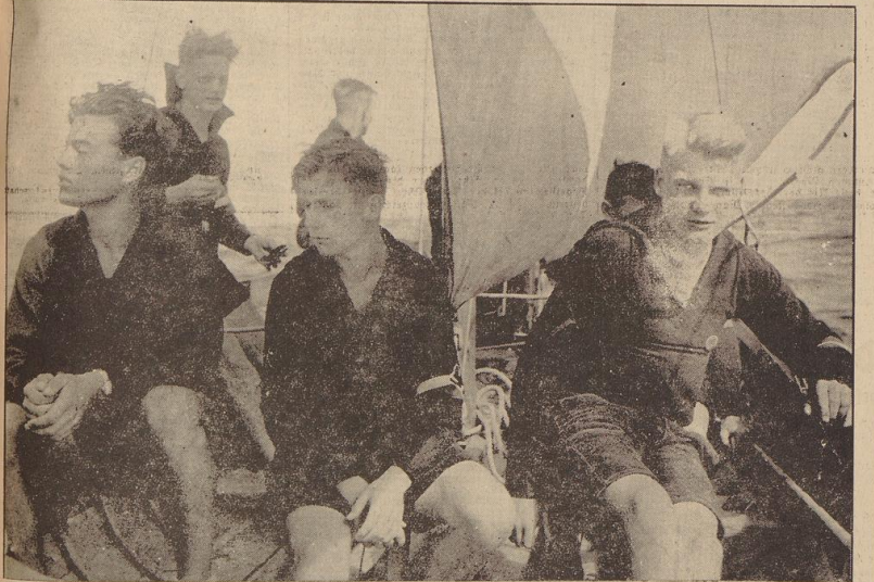
Bremer Marine-HJ. in der Lübecker Bucht. Wer möchte da nicht mitmachen! — Rechts: Bremer der beiden Kutter am Steg. Eben kam vom Segeln zurück. Jetzt wird die Mannschaft gewechselt, und dann geht es wieder ein paar Seemeilen hinaus aufs offene Meer.

Bewußtlich gehabt zu haben, daß ihren Jungen kein schöneres Sommererlebnis gesendet werden kann, als diese Tage in der Kameradschaft der Jungen und in der Schönheit deutscher Ostseelandschaft.