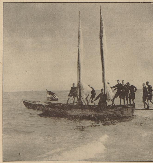
Die Jellingsenabfahrt knüpft sich nach dem Wachen die erste „Acht“ zu meiden, denn wer liegen will, muß zu allererst einmal an Land alles in Ordnung halten können. Und die Jungen bringen es in ihrer Begeisterung zum Segeln in die Nacht fertig, ihr Ziel in knappen 15 Minuten „Acht“ zu meiden.

„Rief! Rief! Qualifiziert die Pfeife des Bootsmanns vom Dienst. Alles raustreten zum „Sich-Waschen“. Am Dauerlauf strömt man zum Meer und mit viel Gelächert geht es in die Brandende See. Dämmerung und Dunkel liegt noch auf dem Wasser und ein etwas böiger Wind aus NW bei Schiffe 6 bis 7 verpflückt eine gute Segelgüte am kommenden Morgen. Die Jellingsenabfahrt knüpft sich nach dem Wachen die erste „Acht“ zu meiden, denn wer liegen will, muß zu allererst einmal an Land alles in Ordnung halten können. Und die Jungen bringen es in ihrer Begeisterung zum Segeln in die Nacht fertig, ihr Ziel in knappen 15 Minuten „Acht“ zu meiden. Die Jellingsenabfahrt führt lassen sich gegenständig im „Kameraden“ der Mann ab. Für diese Werte ist es ein einziges Rennen und Segen. Und es tiappt. Wieder qualifiziert die Bootsmannschaft: „Schiffsführer Bootsmann empfangen“ wird zum nachschubenden Bootsmann ausgesendet. Die Karte liegen nur so zum Frontantel und wenig später