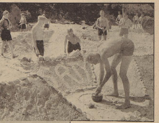
Baden und Burgen bauen! Das ist Brooker Strandleben! Im übrigen wird das Burgenbauen auch als ein besonderer Wettbewerb durchgeführt, bei dem über die Ehre und ein anerkennendes Diplom geht...

Gefahren fechten die Ostpreußenfahrt ab Am Sonntagmorgen um 3:35 Uhr trafen sich die 180 Ostpreußenfahrer der Bremer HJler-Squad vor dem Wandbahnhof zur Abfahrt. Ein letzter Händedruck verabschiedete Jungen und Eltern, von denen immerhin eine größere Anzahl es sich nicht hatte nehmen lassen, ihren Jungen zum Bahnhof zu begleiten, und dann ging es auf den Bahnsteig. Ein letzter Gruß, ein froher Zuruf, und dann entführte sie auch schon der Zug, um sie ihrem Fahrtenziel Ostpreußen näher zu bringen. Ueber Danzig geht die Fahrt nach Trauenmünde, wo sie den Dampf des Seebärens überpreußen begleiten. Eine Seefahrt, die über einen Tag und eine Nacht dauert, schließt sich an. Am Montagmorgen treffen sie in Sildau ein, wo sich dann die Gesellschaft der Ostpreußenfahrer in acht Fahrtengruppen auflöst. Von diesen wird dann zum Aufbruch in den 10 Tagen durchwandert werden. Zum Schluss treffen sich dann alle Teilnehmer wieder zu einer Feierstunde am Tag der Heimkehr und treten gegenseitig die Heimreise an.