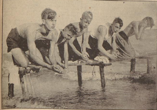
Morgenwäsche am Ostseestrand

Don alten Seebären und reizlegenden Hochseefahrten — Die Meldung lautet: „Kotpanische U-Boote in der Lübecker Bucht gesichtet und nach heftigem Kampf vernichtet“