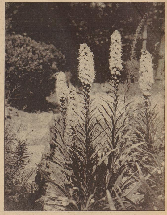
Die Prachtsscharte, eine wenig bekannte und doch so schöne Staude

Pflanzenausbau zu jeder Zeit. Mühllinge im Garten. Allmonatlich haben wir des so wichtigen Pflanzenausbaus gedacht.