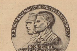
„Nordsee-SS“ dankt der Alten Garde! So lautet die Parole zum 2. Gebietsaufmarsch vom 13. bis 15. August in Bremen.