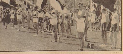
Das Internationale Sportfest in Olympia-Stadion. Unser Bild zeigt den Fahnenmarsch in das Olympia-Stadion am Reichspalast anlässlich der Internationalen Sportfestes am 1. August in Berlin.

Am Sonntag wurden bei den Weltmeisterschaften in Berlin die Ringe um die Weltmeisterschaften im Ringen ausgetragen. Die internationale Flugmeisterschaft wurde am Sonntag durch ein Unfallschicksal auf dem Flughafen von London unterbrochen.