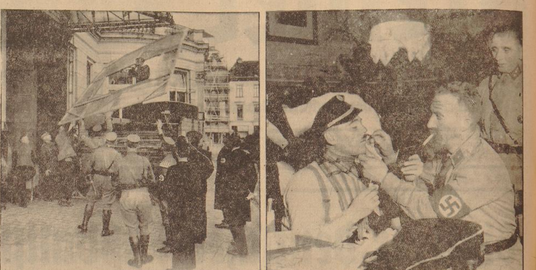
Die Theatergruppe der SA. läßt auf dem Lande Kulturarbeit leisten. In Helligerode spielen sie am Sonntagabend den Sturmabmarsch 11/75.

Theatergruppe der Bremer SA. spielt in Helligerode — Nachmarkt und Kameradschaftsabend des Sturmabmarsches 11/75