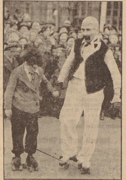
„Vater und Sohn“ waren ganz groß