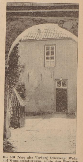
Die 500 Jahre alte Vorburg beherbergt Wohn- und Gemeinschaftsräume, sowie eine Werkstatt