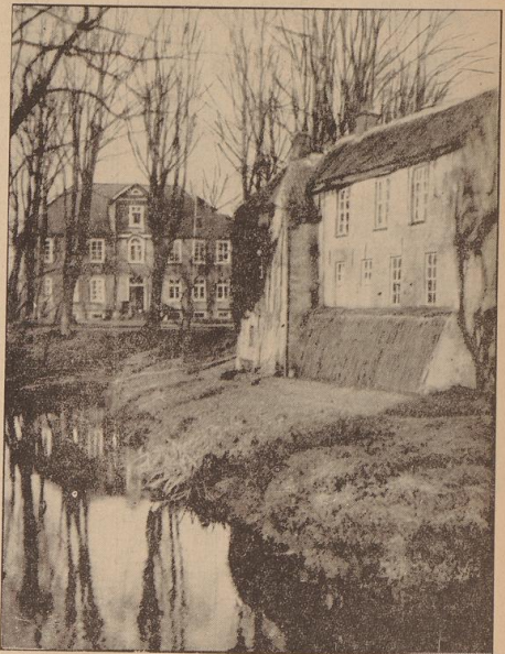
Um das alte Gemäuer der Pewsumer Burg zieht sich noch heute der Wassergraben (Aufn.: Gauschule Pewsum (7))

Gauschule Pewsum Garanti für die weltanschauliche Ausrichtung des Führernachwuchses im Gau Weser-Ems • „B.Z.“ besucht den 500jährigen HAUPTLINGS-SITZ in Ostfriesland