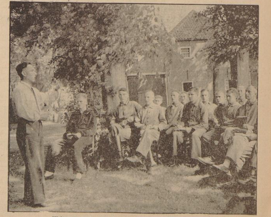
Weltanschauliche Schulung unter den Linden im Burghof