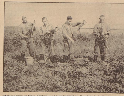
Selbstpflichten im Felde. 6 Hektar Land bewirtschaftet die Gauschule in fleißiger Arbeit selbst

größeren Umfang an die Partei und an ihre politischen Leiter herantraten. Die unverrückbare Grundhaltung, die diesen Männern in ihrem Lehrgang durch den Gauleiter und die Auszubildeten, vor allem aber durch gegenseitige Formung und durch die Lehrgangsgemeinschaft eingeprengt wurde, die Grundzüge der Idee, die in ihnen verankert sind, lassen um den Erfolg ihres Einflusses nicht bangen. Charaktere und Können aber in harter Auslese, jeder einzelne unter Bestehen der Lehrgangsgemeinschaft ist nicht etwa eine Einzeltätigkeit, die die einfachsten Voraussetzungen eines Führertums den jungen Lehrgang anstreben soll, zumal auch diese Eigenschaften nicht amoenen werden können, sondern durch eine langjährige Auslese soll hier verankert werden, nach demselben Maßstab und damit zur vollen Entfaltung zu bringen. In der geistigen Ausbildung wird nach verschiedenen Gesichtspunkten vorgegangen. Nationalpolitisch, Geschichte, Kulturgeschichte und Weltanschauung, Religions- und Wehrpolitik sind die Themen, nach denen die Schulung vor sich geht. Nach einer allgemeinen Einführung im ersten Semester folgt im zweiten Semester eine tiefe Auseinandersetzung mit dem Nationalismus, im dritten Semester die Auseinandersetzung mit dem Individualismus und viertens eine tiefe Auseinandersetzung mit dem Sozialismus. Das alles nicht als große Linie, sondern durch die Lehrgangsgemeinschaft, die Lehrgangsgemeinschaften sind auf Pewsum ständig der Schul-