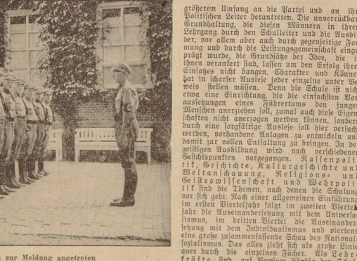
Lehrgang II Gauschule Pewsum zur Meldung angetreten

größeren Umfang an die Partei und an ihre politischen Leiter herantraten. Die unverrückbare Grundhaltung, die diesen Männern in ihrem Lehrgang durch den Gauleiter und die Auszubildeten, vor allem aber durch gegenseitige Formung und durch die Lehrgangsgemeinschaft eingeprengt wurde, die Grundzüge der Idee, die in ihnen verankert sind, lassen um den Erfolg ihres Einflusses nicht bangen. Charaktere und Können aber in harter Auslese, jeder einzelne unter Bestehen der Lehrgangsgemeinschaft ist nicht etwa eine Einzeltätigkeit, die die einfachsten Voraussetzungen eines Führertums den jungen Lehrgang anstreben soll, zumal auch diese Eigenschaften nicht amoenen werden können, sondern durch eine langjährige Auslese soll hier verankert werden, nach demselben Maßstab und damit zur vollen Entfaltung zu bringen. In der geistigen Ausbildung wird nach verschiedenen Gesichtspunkten vorgegangen. Nationalpolitisch, Geschichte, Kulturgeschichte und Weltanschauung, Religions- und Wehrpolitik sind die Themen, nach denen die Schulung vor sich geht. Nach einer allgemeinen Einführung im ersten Semester folgt im zweiten Semester eine tiefe Auseinandersetzung mit dem Nationalismus, im dritten Semester die Auseinandersetzung mit dem Individualismus und viertens eine tiefe Auseinandersetzung mit dem Sozialismus. Das alles nicht als große Linie, sondern durch die Lehrgangsgemeinschaft, die Lehrgangsgemeinschaften sind auf Pewsum ständig der Schul-