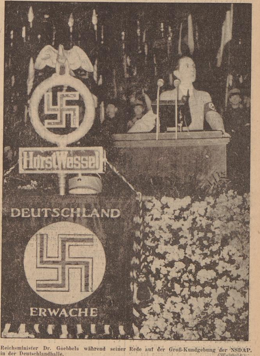
Reichsminister Dr. Goebbels während seiner Rede auf der Groß-Kundgebung der NSDAP...