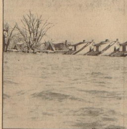
Bis zu den Dächern stieg das Wasser. Ein „Strahlenbild“ aus dem Wohnviertel von Vansville im State Indiana. Der reisende Strom reicht bis zu den Dächern hinein.

In Poignon ereignete Donnerstag nachmittag eine schwere Explosion in einem dreistöckigen Gebäude, deren Ursachen und Folgen noch nicht bekannt sind.