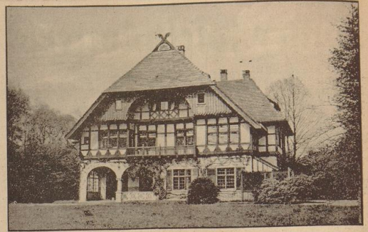
Eingebettet in einem prächtigen Park, umgeben von Spielweiden und Blumenbeeten, liegt das Muttererholungsheim „Blumenkamp“ in St. Magnus.

Der gewaltige Unterschied in der Entwicklung des Reiches und des Einzelnen macht eine Ausdehnung der Reichsleistungen dringend notwendig. Gemeinnütziges Gebiet und gemeinsame Aufgabe, die Stadt, die ihr eigenes Gebiet bereits