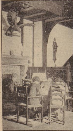
Lesestunde am Kamin.

Zu einem tiefstehenden Erlebnis gelangte sich die Besichtigungsfahrt des 2. Lerngangs der Gauschulungsburg Pewsum zum Gau Weser-Ems, die auf Einladung des Gauamtsleiters der NSV. Hg. Otto Denker, durchgeführt wurde. In zweitägiger Rundfahrt genossen die Lerngangsteilnehmer, die Anfang März, nach Beendigung der einjährigen weltanschaulichen Ausbildung auf der Burg Pewsum, in die praktische Arbeit der Partei und ihrer Gliederungen einzutreten, einen freien Einblick in die Arbeiten und Einrichtungen der NSV. und