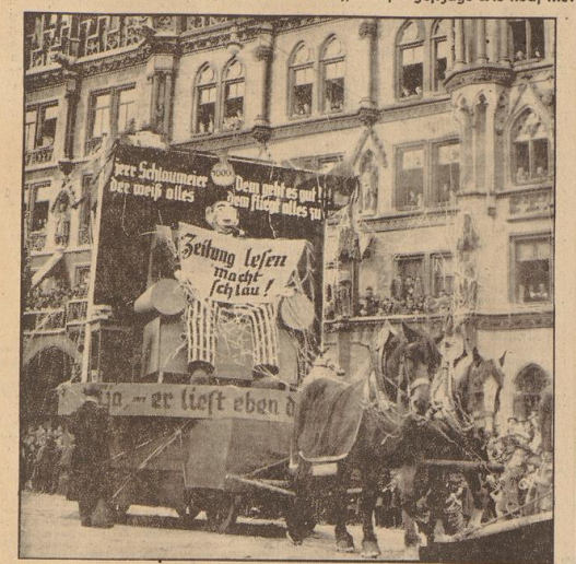
München im Faschingstrudel. Herr Schlaumeier liest eben Zeitung! Eine Gruppe aus dem fröhlichen Faschingzug.

Braufendes Karnevalstreifen in Köln und Düsseldorf — Festzüge wie noch nie!