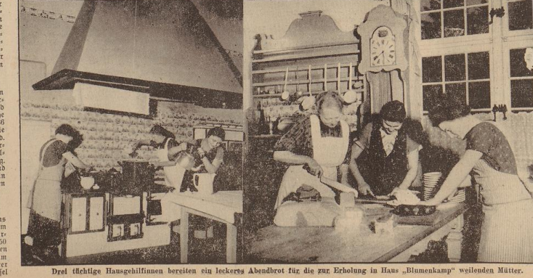
Drei tüchtige Hausgehilfinnen bereiten ein leckeres Abendbrot für die zur Erholung in Haus „Blumenkamp“ weilenden Mütter.

31. Dezember 1936 und außerdem 8399 Mitglieder. Diese Zahlen sind gerade in den letzten Monaten fast ungleich, denn durch Erkenntnis der Volksgenossen, sich einzureihen in die Front der Nationalisten wird immer deutlicher. Bedauernd ist es überaus für einen Parteigenossen, heute noch nicht Mitkämpfer in der NSV. zu sein.