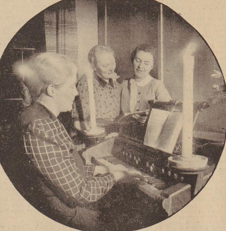
Zweistimmig singt sie sich so schön, wenn die Hausorgel begleitet.

en und nach Jmiffenbahn ging es nach einem Besuch im Ammerländer Bauernhaus zur Besichtigung der