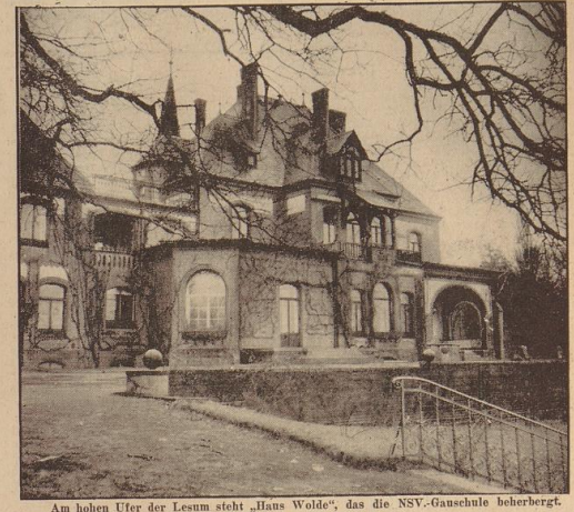
Am hohen Ufer der Lesum steht „Haus Wolde“, das die NSV.-Gauschule überbergt.