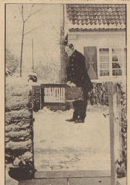
Der Beamte der Rundfunkentfernungsdienststelle des Telegraphenamts forscht mit Kopfhörer und Suchgerät in allen Winkeln nach Störquellen.

„Hier ist der Teufel los, das brummt und jählt, laßt und brüllt, knurrt und knarrt, daß man kaum sein eigenes Herz verstehen kann. Können Sie das nicht abhören? Dieser Hölleufel hat ja seine eigene Sprache, die er in der Nacht zu hören, daß bald nach allen Seiten hin der Teufel losbricht. Eine ganze Kolonne wird aufeinander zurollen. Die Teufel werden in Kränzen gefaßt und abgeholt auf die Straße. In einer stillen Nacht, der man es nicht anieht, daß dort ein Teufel im freien Feld treiben könnte, wird angehalten. Das Haus des Teufelbesizers wird aufgedrückt. Gut, daß sie jetzt kommen.“