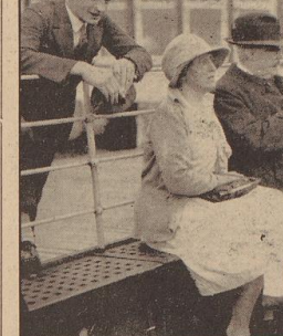
Der General während einer Bootfahrt auf dem Zwischenufer

Erinnerungen an die kurzen Aufenthalte des vereinigten Generals in unserer Hansestadt