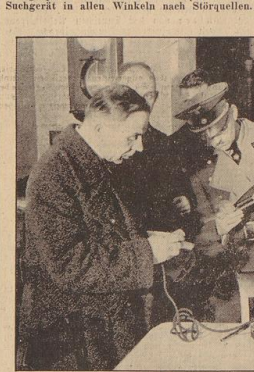
Der kleine Lebeltäter, ein Heilgerät, ist gefunden. Er hat vielen Hören mancher Rundfunkgenieß gestört.

Sicherheit, die seinen Widerstand zuläßt, heißt der Beamte das, was er in seiner Lebenszeit nicht mehr hören wird, als der Teufel plötzlich verflucht. Die Hausbesitzer kommen an die Tür. Sie sehen einen Stäubler in weißer Kleidung. „Ja, aber...“