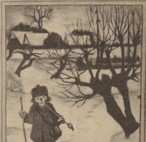
Mer ist lütt Puck?