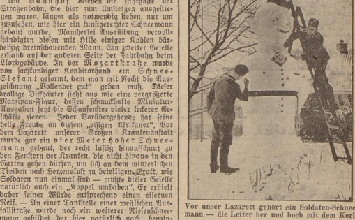
Vor unser Lazarett geht ein Soldaten-Schneemann - die Leiter her und hoch mit dem Kerl!