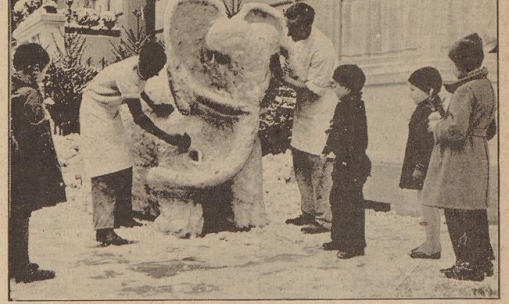
Der 'eigige Arbeiter' an der Ecke Mozartstraße - man sieht doch gleich, was geschickte Konditionen sind!

Parade der Schneemänner - Kampf auch dem letzten Schneehaufen