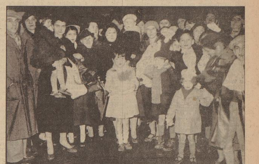
Gegen die hohen Milchpreise in Paris. Dieser Tage veranstalteten Frauen und Kinder vor dem Rathaus in Paris eine Protestkundgebung gegen die hohen Milchpreise.

Treuehuldigung für den Duce Die Worte Mussolinis über den Austritt aus dem Völkerbund wurden mit einem grandiosen, organisierten Beifall aufgenommen. Getten, die vielen Anwesenheiten, die in Italien bei ähnlichen Gelegenheiten selten sind, wurden die Hände gefasst und die Gesichter mit einem Ausdruck der tiefsten Freude erfüllt.