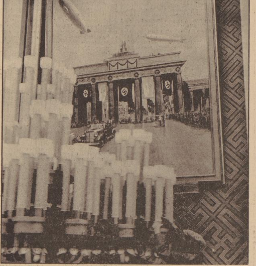
Eine der 22 Riesengemälde, die eindrucksvollste Blickfänge der Seitenwände der großen Halle sind.

Die Schönheit des Deutschen Hauses wird durch die Überfüllung und Klarheit des Ganzen in seiner Teilheraushebung ausgedrückt. Die Schönheit des Deutschen Hauses wird durch die Überfüllung und Klarheit des Ganzen in seiner Teilheraushebung ausgedrückt. Die Schönheit des Deutschen Hauses wird durch die Überfüllung und Klarheit des Ganzen in seiner Teilheraushebung ausgedrückt.