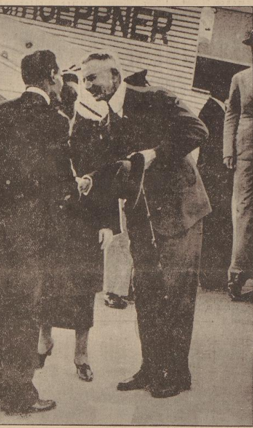
Bei seiner Ankunft auf dem Pariser Flughafen Le Bourget wurde Reichshauptpräsident Dr. Schacht vom französischen Wirtschaftsminister Spinasse begrüßt.

überbannenden Büsten zeigen, was die Zukunft aus dem eigenen Amputat zu lächeln vermocht hat. Das Haus der Ausstellungen möge ein paar mildere Gaben illustrieren: Im Jahre 1890 stellte sich die Welt-Exposition an Rheinbrücken auf 28 Mill. T.o., im Jahre 1900 auf 80 Mill. T.o. Die ständige Aufbauperiode wurde durch den Weltkrieg des Weltkrieges unterbrochen, die allen Völkern, Siegern und Besiegten, lohnender Stunden geschlagen hat, das es heute noch nicht gelungen ist, sie zu stellen.