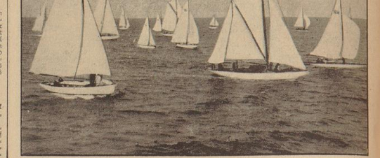
Heute beginnt die Nordseewoche. Unser Bild zeigt den Massenstart von der Wettfahrt zum Hohenberg bei der vorjährigen Nordseewoche.

Die beiden im Pfingstsonntag im Breslauer Hermann-Göring-Stadion stattfindenden deutschen Dänemarkkämpfe sind ein Ereignis von besonderer Wichtigkeit. Die beiden Kämpfe sind die ersten, die in einem großen Stadion vor einer großen Zuschauermenge stattfinden werden.