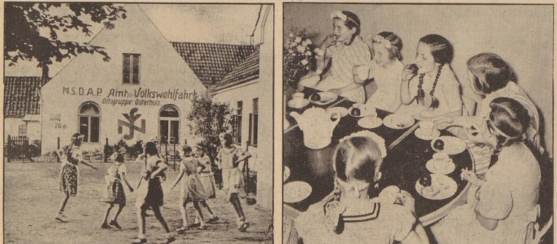
Fröhlicher Kinderreigen auf dem Spielplatz. Nach der Arbeit ist gut futtern! Aufn.: Schmidt (2)

Aus eigenen Mitteln und eigener Arbeitsleistung (auf die NSD-Ortsgruppe Osterholz einen vorbildlichen Kindergarten