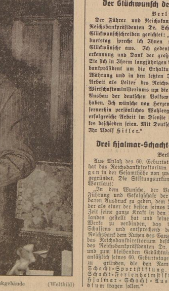
Dr. Schacht in seinem Arbeitszimmer im Reichsbankgebäude

Der Führer und Reichsführer hat an den Reichsbankpräsidenten Dr. Schacht nachfolgendes Glückwunschschreiben gerichtet.