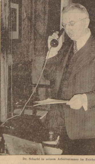
Dr. Schacht in seinem Arbeitszimmer im Reichsbankgebäude

Aus Anlaß des 60. Geburtstages Dr. Schachts hat das Reichsamt für Wirtschaftsprüfung drei Stiftungen in der Gesamthöhe von zwei Millionen RM gegründet.