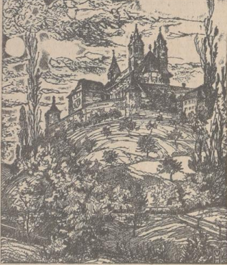
Die Umgebung bei Godes. Hall