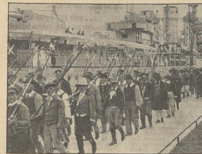
Pillau, 800 Jahre Garrison. Die Feiertagsfeier zum 800jährigen Bestehen der Garrison Pillau...