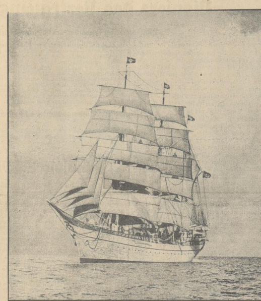
Segelschiff „Gorch Fock“, das Schwesterschiff der „Horst Wessel“, in voller Fahrt

Allein für Deutschland. Im Ringen Adolf Hitlers um die Erfüllung dieser Idee zur Idee Deutschlands, im Ringen um das Werden des Dritten Reiches ließ Horst Wessel sein Leben aufgeben im Dienst am Führer und an seiner Idee.