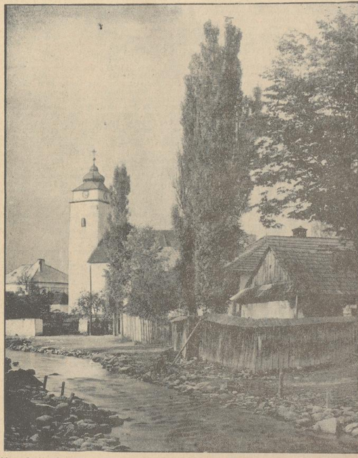
Schlagendorf in der Zips

Die Bewerber müssen ein hervorragendes technisches Können, ein hervorragendes geistiges und körperliches. Die Bewerber müssen ein hervorragendes technisches Können, ein hervorragendes geistiges und körperliches. Die Bewerber müssen ein hervorragendes technisches Können, ein hervorragendes geistiges und körperliches.