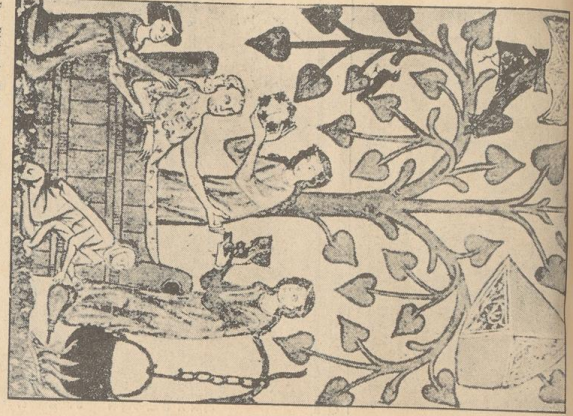
Der Ritter im Bade, Museumskunst, Handzeichnung (U. Jahrbuch).

Die Geschichte Badenweilers ist eng mit der Geschichte der Gemeinde verbunden. In der Vergangenheit war Badenweiler ein Ort, der für seine Schönheit und seine Lage am See bekannt war. Heute ist Badenweiler ein Ort, der für seine Kultur und seine Geschichte bekannt ist. Die Geschichte Badenweilers ist eng mit der Geschichte der Gemeinde verbunden.