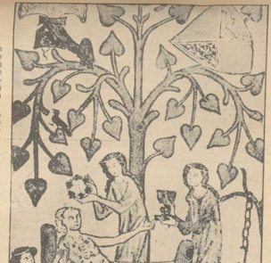
Der Ritter im Bade, Manuskript Handschrift (14. Jahrhundert).

Die Kulturgeschichte der Menschheit ist eine Geschichte der Vielfalt. In jeder Phase der Menschheit haben sich verschiedene Kulturen entwickelt, die jeweils ihre eigenen Werte, Normen und Traditionen haben. Diese Vielfalt ist ein Zeichen der Reife der menschlichen Zivilisation.