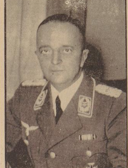
den Jahren nach dem Kriege wurde Löb für die Generalstabsausbildung der Fronttruppe herangezogen. Die Jahre 1926 bis 1930 lagen ihm im Truppenamt des Reichswehrministeriums; im Februar 1931 wurde er Kompanieführer und war vom März desselben Jahres an für ein Jahr Generalstabsoffizier, um dann von 1934 an als Chef des Bedienungswelens im Reichswehrministerium tätig zu sein. Vier machte sich 1935