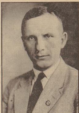
besonders verdient beim Aufbau der deutschen Luftfahrtindustrie. — Der Arbeitseinsatz wird von