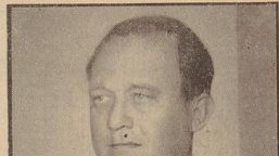
Leiter der Sozialpolitischen Hauptabteilung dieses Ministeriums obliegt ihm die Bearbeitung von Fragen des Arbeiterechts, der Wohnpolitik und des Arbeitsschutzes. — Ihm zur Seite steht der Präsident der Reichsanstalt für Arbeitsvermittlung und Arbeitslosenversicherung

er zunächst stellvertretend in der Jugendbewegung tätig, bis er 1925 Mitglied der NSDAP wurde. Als Stadtratsmitglied in Weingheim (1927) und als Landtagsabgeordneter und Fraktionsführer in Baden (1928) wurde er 1929 zum stellvertretenden Gruppenleiter ernannt. Als kommissarischer Leiter des badischen Reichsarbeitsministeriums wurde er am 6. Mai 1933 Ministerpräsident und badischer Gruppen- und Wirtschaftsminister.