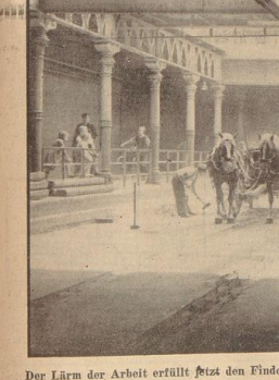
Der Lärm der Arbeit erfüllt jetzt den Findorf-Tunnel.