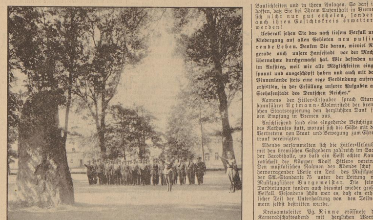
Vom dem Johann-Gosel-Stein: Der Gruß der ermordeten Kämpfer der Bewegung.

Gedenkfeier am Johann-Gosel-Stein — Empfang im Rathaus — Kameradschaftsabend in der Jacobihalle